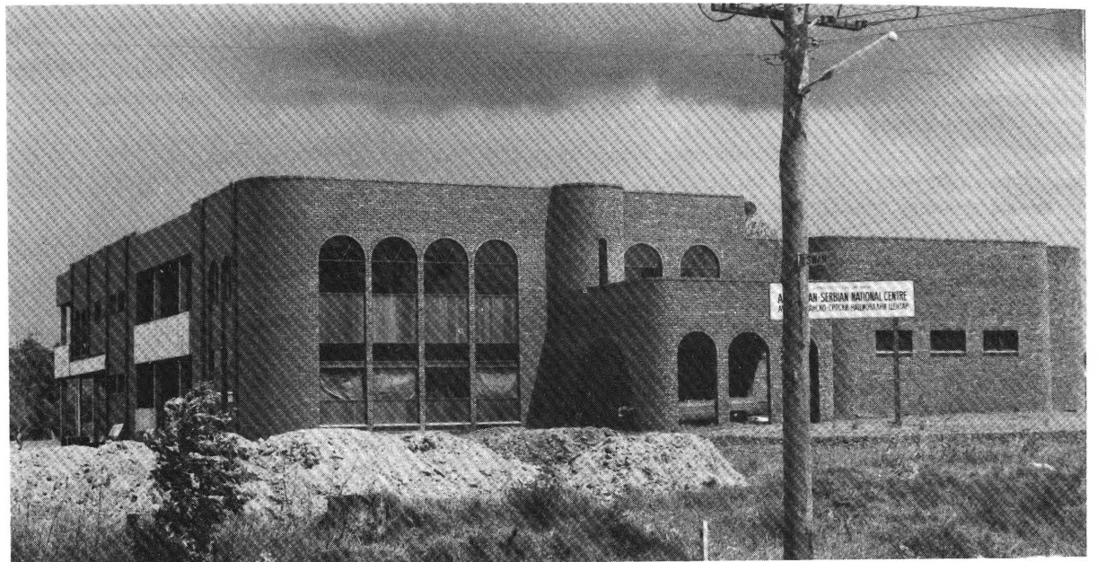
Ово је слика још недовршеног величанственог Дома Покрета српских четника Равне Горе у Аустралији, у предграђу најлепшег града Аустралије Сиднеја, у Бониригу. Дом ће коштати два милиона долара док се заврши. То је најлепши и највећи Дом Срба у слободном свету. Скоро сви досадашњи радови на Дому завршени су добровољним радом српских бораца који су сваки посао на Дому завршавали песмом. Овај ће Дом бити зборно место и национално огњиште свих родољубивих Срба настањених у Аустралији. (Види опис Дома на страни 6. у чланку којег преносимо из штампе у Аустралији)